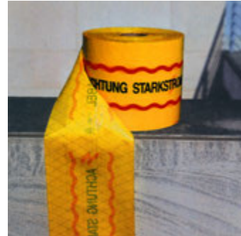
Kabelabdeckfolie mit Spezialgitter-Einlage