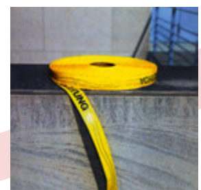
Ortungsband mit Stahl-drahteinlage