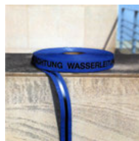
Ortungsband mit Edelstahlband

Standardfarben gelb, blau, rot, grün. Schriftfarbe schwarz oder schwarz/rot.